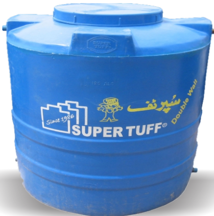
DOUBLE PLY WATER TANK

THE ONLY FOOD GRADE WATER TANK IN PAKISTAN